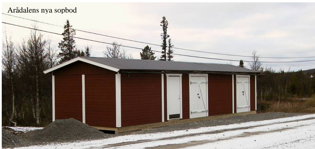
Arådalens nya sobod